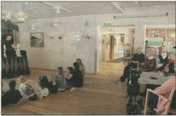
HOLDT OPPMERKSOMHETEN: Både små og store var tydelig fornøyd med forestillingen.